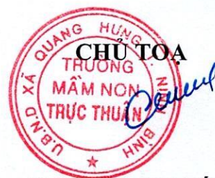
LƯƠNG THỊ CÚC

Biên bản được thông qua tại Hội nghị vào lúc 15 giờ cùng ngày và các thành phần tham dự không có ý kiến gì khác./.